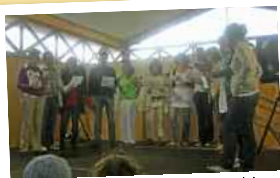
Irakasleak bertso bat eskeintzen.