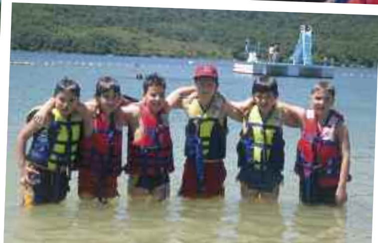
Bero asko egiten zuen eta uretan gustura ibili ginen.