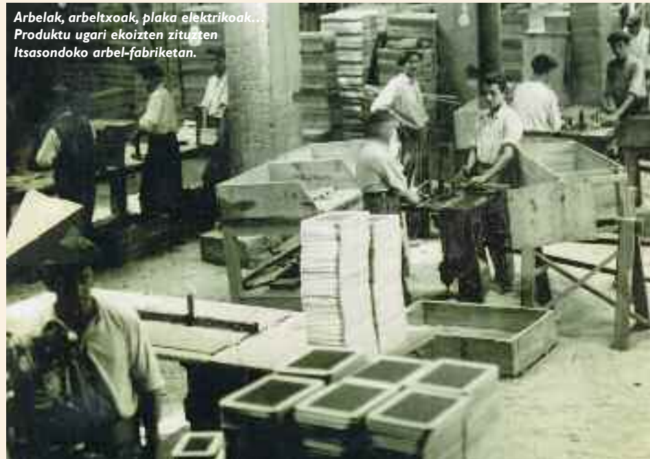
Arbelak, arbeltxoak, plaka elektrikoak... Produktu ugari ekoizten zituzten Itsasondoko arbel-fabriketan.