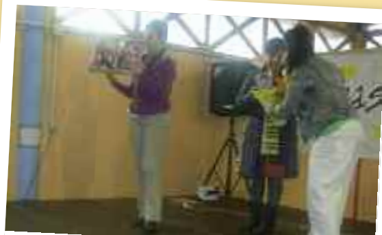
Gurasoak eskerrak ematen.

Zuzendaritzan ta irakaskuntzan aritu zara jo ta ke sekula ere ez zara egon Itsasondotik aparte ta horregatik bihurtu zara gure bizitzaren parte ta irekita dauzkazu hemen bai bihotz ata bai ate nahi duzunean bisita egin, milesker bihotzez MAITE.