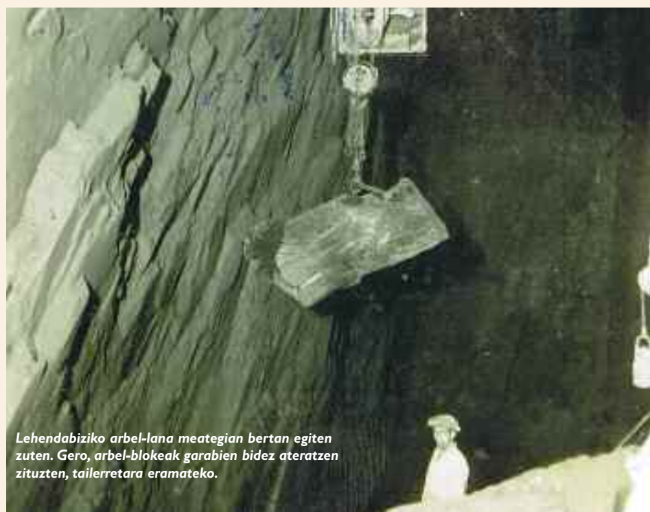
Lehendabiziko arbel-lana meategian bertan egiten zuten. Gero, arbel-blokeak garabien bidez ateratzen zituzten, tailerretara eramateko.