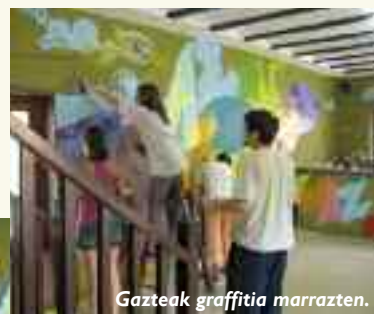
Gazteek graffitiak marrazten.

Gaztelekuaz gain, Itsasondoko Haur eta Gazteria Sailak, ikastaro eta ekintza berriak egin nahi ditu ikasturtean zehar, nerabe eta gazteek egin dituzten eskaerei erantzuteko. Momentu honetan, hainbat aukera aztertzen ari gara, eta, eskaintzak eskura ditugunean, herriko gazteei izena emateko aukera emango dugu. Haurrentzako ekintza gehiago egiteko asmoa ere badugu. Gabonetako eta Aste Santuetako ekintzek izan duten arrakasta ikusita, modu horretako ekintza gehiago egiteko asmoa dugu. Herri bizitza taldean erabakiko da.■