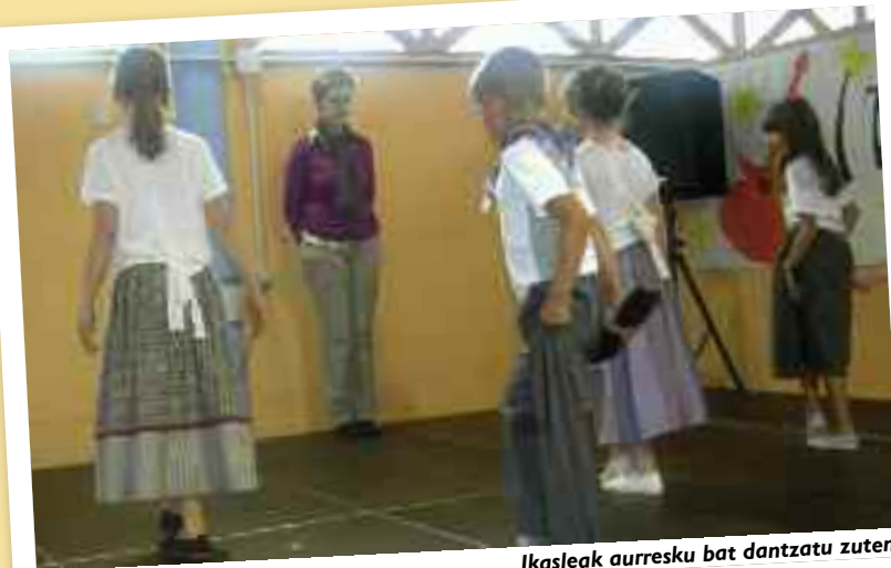
Ikasleak auresku bat dantzatu zuten.