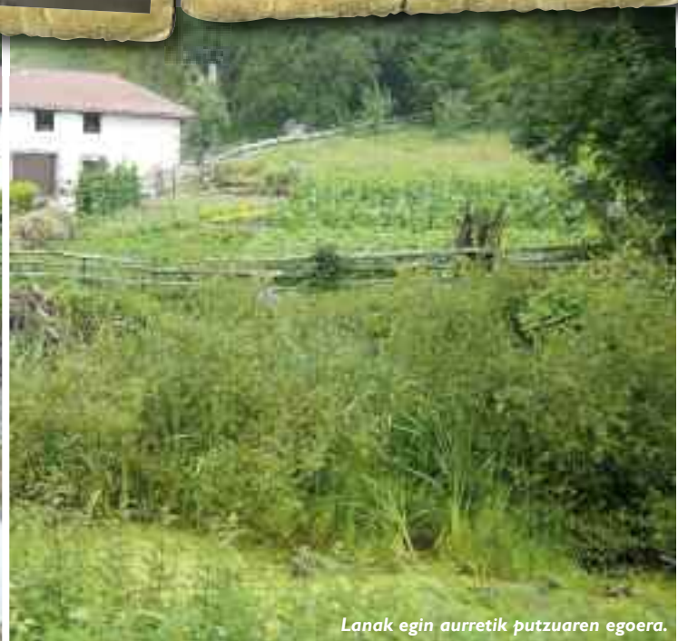
Lanak egin aurretik putzuaren egoera.