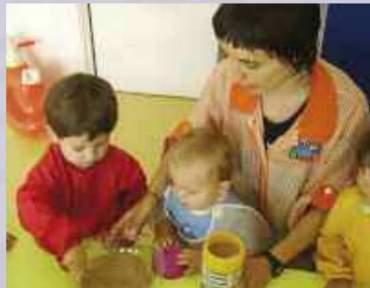
Haurrek material ezberdinekin esperimentatzen dute.

Oporrak pasa dira, eta aurtengo ikasturtea 17 haurrekin hasiko dugu! Baina, irailean, beste matrikula epe bat zabalduko dugu. Beste sei haurrentzako tokia dago oraindik; beraz, nahi duena etorri dadila informazio eske. Hemen egongo gara zain! ■