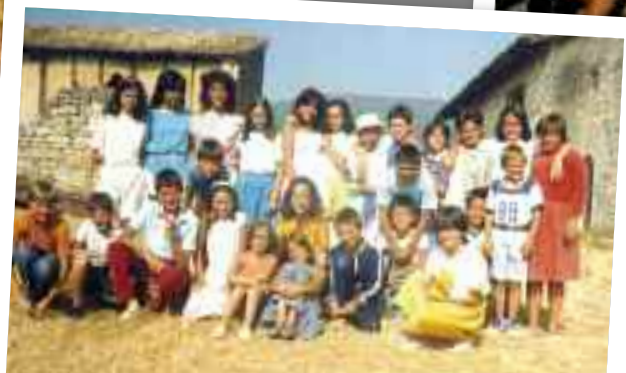
Izuko etxe aurrean ateratako argazkia.