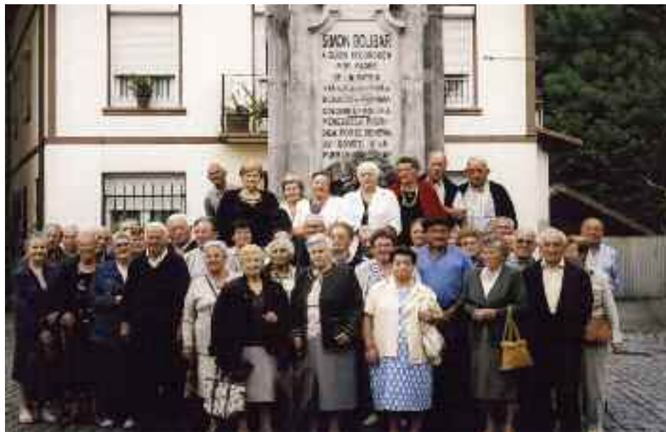
Jubilatuak Simon Bolibarren oroigarriaren aurrean.

Aurrez erabakita genduenez, Simon Bolibar "Askatzailearen" museoa ikusi gendun. Garai bateko Errementarikua baserrian dago. Txikia da, bañan nola dena "Askatzaileari" eskeiñita dagoen, aundia ematen du. Bere jaiotza, Venezuelan 1783 urtean izan zan eta eriotza, Colombian, 1830n. Bere genealogia, ibilbide pertsonala eta politikoa, Europara egin zituen bi bidaiaren berri, liburuak, itzaldiak, garai artako diruak eta abar, bertako horma eta maietan ageri dira. Ikustekoa!