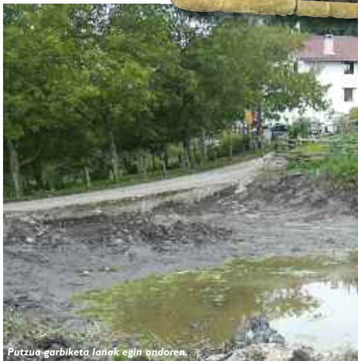
Putzua garbiketa lanak egin ondoren.