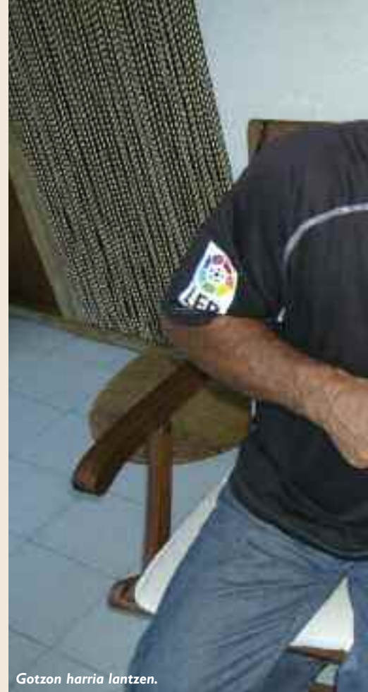
Gotzon harria lantzen.

Bai, eta horietako bat nirekin RENFEn dudana lankide bat da. Kasu horretan, ni aritu nintzen berari tailatzen irakasten, eta orain izugarriko artista egina dago.