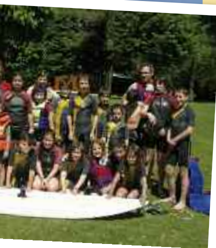
Talde guztia surf egiteko prest.