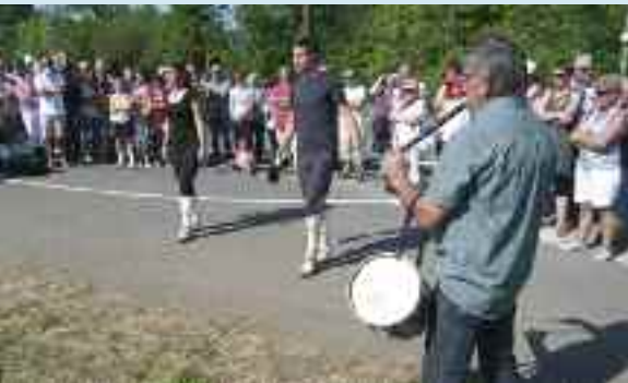
Txatoren oroigarriaren aurrean dantzariak aureskua eskeini zioten.