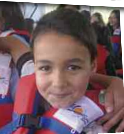
Barkura igotzeko txalekoa jarri eta uharterako bidean.