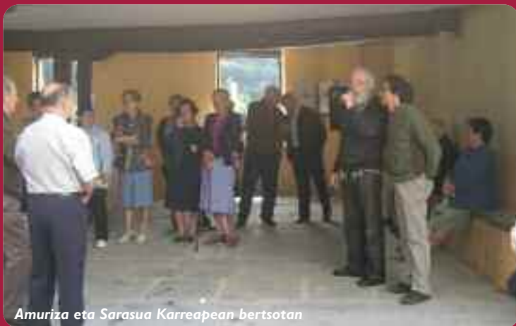
Amuriza eta Sarasua Karrapean bertsoan