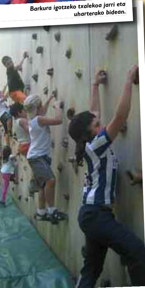
Irlan zehar zirkuito bat zegoen eta horietako bat eskalada egitea zen.