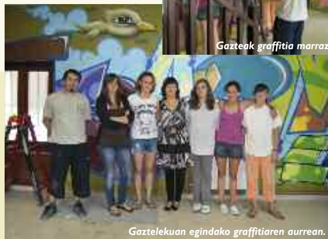
Gaztelekuan egindako graffitiaren aurrean.