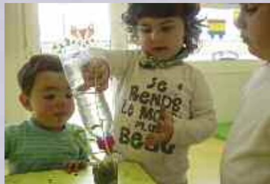
Landareak ureztatu behar dira.