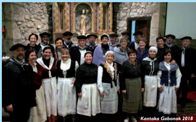
Kantaka Gabonak 2018