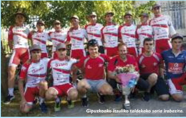
Gipuzkoako Itzuliko taldeko saria irabazita.