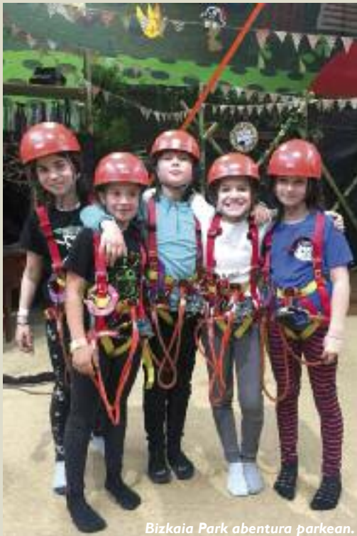
Bizkaia Park abentura parkean.