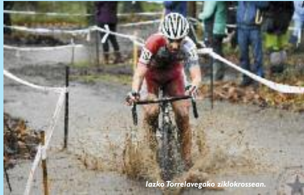
Iazko Torrelavegako ziklokrossean.

karrak (barreak), baina betidanik nahi nuen txirrindularitzan lehiatu. Hasi eta berehala jakin nuen baietz, gustatzen zitzaidala. Hasieran gogoz hartu nuen, baina sekula lasterketarik egin gabekoa nintzen, ez nengoen ziur nire erabakiaz. Halere, lasterketa bat egitea nahikoa izan zen, gustuko nuen.