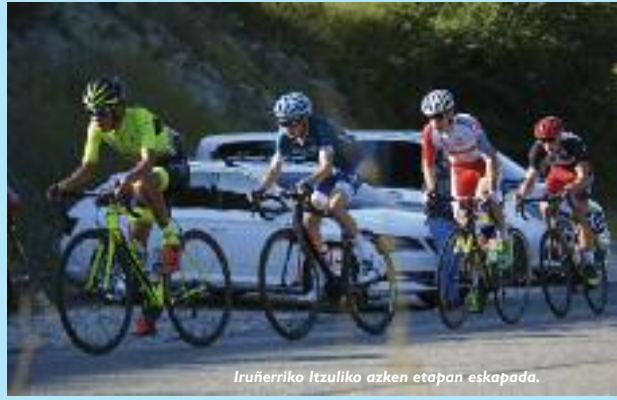
Iruñerriko Itzuliko azken etapan eskapada.