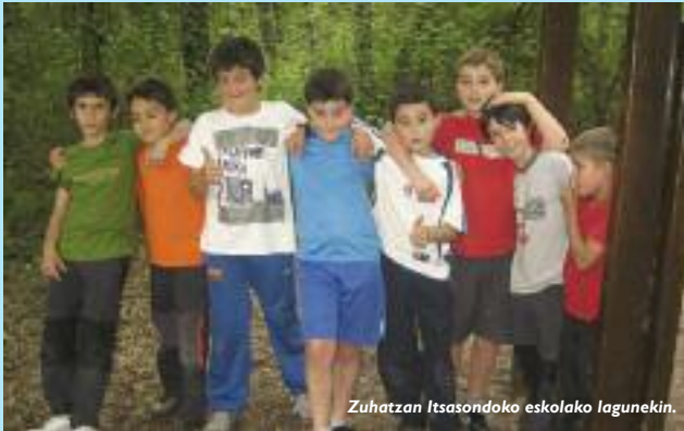
Zuhatzan Itsasondoko eskolako lagunekin.